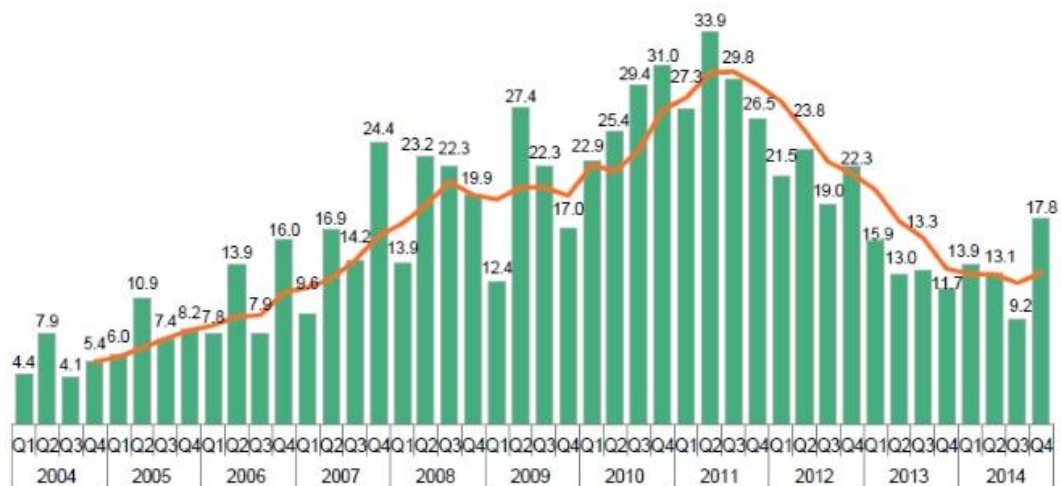
图3 2004—2014年欧洲国家清洁能源投资增长情况（10亿美元）