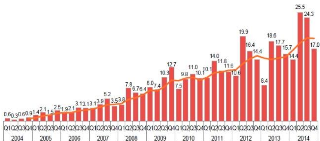
图 1 2004—2014 年中国清洁能源投资增长情况 (10 亿美元)

清洁能源投资额达到 518 亿美元（比 2013 年增加 8%）（图 2），其后是日本投资达到 413 亿美元（比 2013 年增加 12%）。加拿大和巴西的贡献则较为有限，这两个国家 2014 年清洁能源投资额分别为 90 亿美元和 79 亿美元，但是这两国相较本国 2013 年的增长率分别为 26% 和 88%。欧洲国家总的投资额达到 660 亿美元，远低于其 2011 年的投资额峰值（图 3）。气候组织特别指出，印度清洁能源市场发展趋势与全球积极态势一致。2014 年印度清洁能源投资额达到 79 亿美元，预计 2015 年底该国投资额将达到 110 亿美元（图 4）。气候组织印度主管表示，美国奥巴马总统在访华期间与印度达成的美—印气候合作将帮助印度完成其雄心勃勃的可再生能源增长计划。