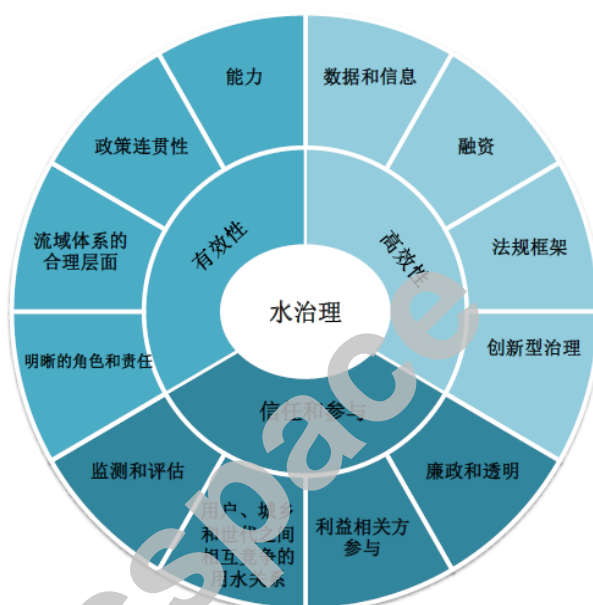
图 1 OECD 水治理原则

OECD 所建立的水治理原则，旨在为制定可见的、注重成果的公共政策提供帮助，这些政策的制定与实施可以促进建设更好的城市，能够帮助更好地管理城市的水资源或者污水处理等。所以，水治理由三个相辅相成的层面构成（图 1）：