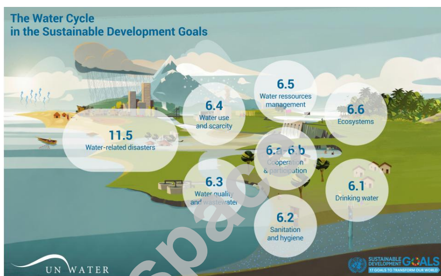
图 1 基于可持续发展目标的水循环

从图1中可以看出，联合国2030发展议程中提出的涉水目标，涵盖了全球水循环的整个过程，所制定出的可持续发展目标、思路 and 方向对全球水资源开发利用和节约保护将会产生重要影响，并且将朝着解决涉水部门和区域碎片化管理迈出第一步。